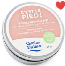
Beurre réparateur pour pieds et main s