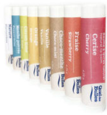
Baumes à lèvres n aturels