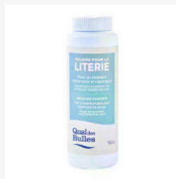
Poudre pour l a literie