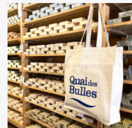
Sac réutilisab le en tissu