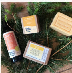
Trousse plein air

Voici quelques idées de produits à emporter sur la route :